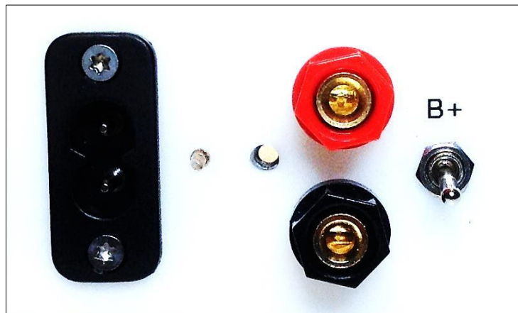
Grafik 8: Bassanhebung

Die Wiedergabeintensität der tiefen Frequenzen hängt von der Aufstellung (s. Kap. 4 ff) und vom verwendeten Verstärker (z.B. Röhren- oder Transistorverstärker) ab. Mit Hilfe des an einem Anschlussfeld verbauten Schalters lässt sich der Bass im Bereich von 40 bis etwa 70 Hertz um 3 dB anheben (B+ Stellung). Diese Option besteht nicht mehr in der MK II - Version (ab S/N 055/056). Die Bassanhebung ist hier dauerhaft eingerichtet.