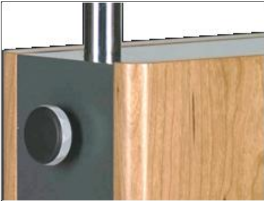
Grafik 6: Handrad am Elektronikgehäuse