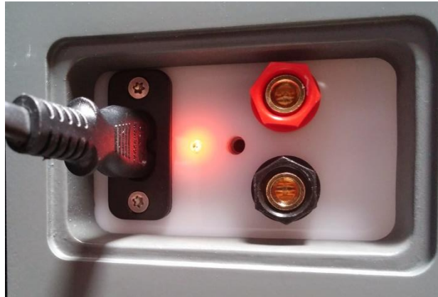
Grafik 2: Eins von 2 Anschlussfeldern

Bitte beachten Sie die maximale elektrische Belastbarkeit des ESL HOME beim Anschluss Ihres Verstärkers (s. techn. Daten). Um die höchste Wiedergabequalität zu erreichen, sollten hochwertige Verstärker ausgewählt werden. Dabei ist der ESL HOME nicht „Impedanz kritisch“. Sowohl Röhren- als auch Transistorverstärker sind geeignet. „Single Ended“ Verstärker wurden erfolgreich getestet.