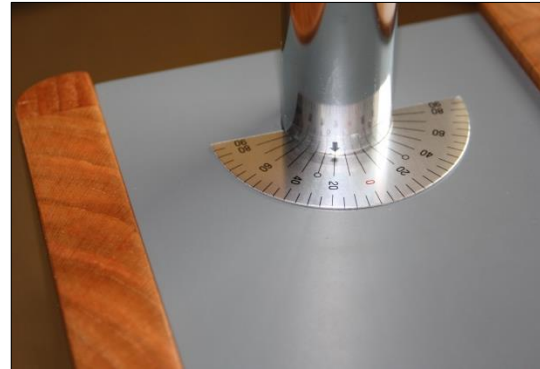
Grafik 7: Einstellhilfe Winkelskala