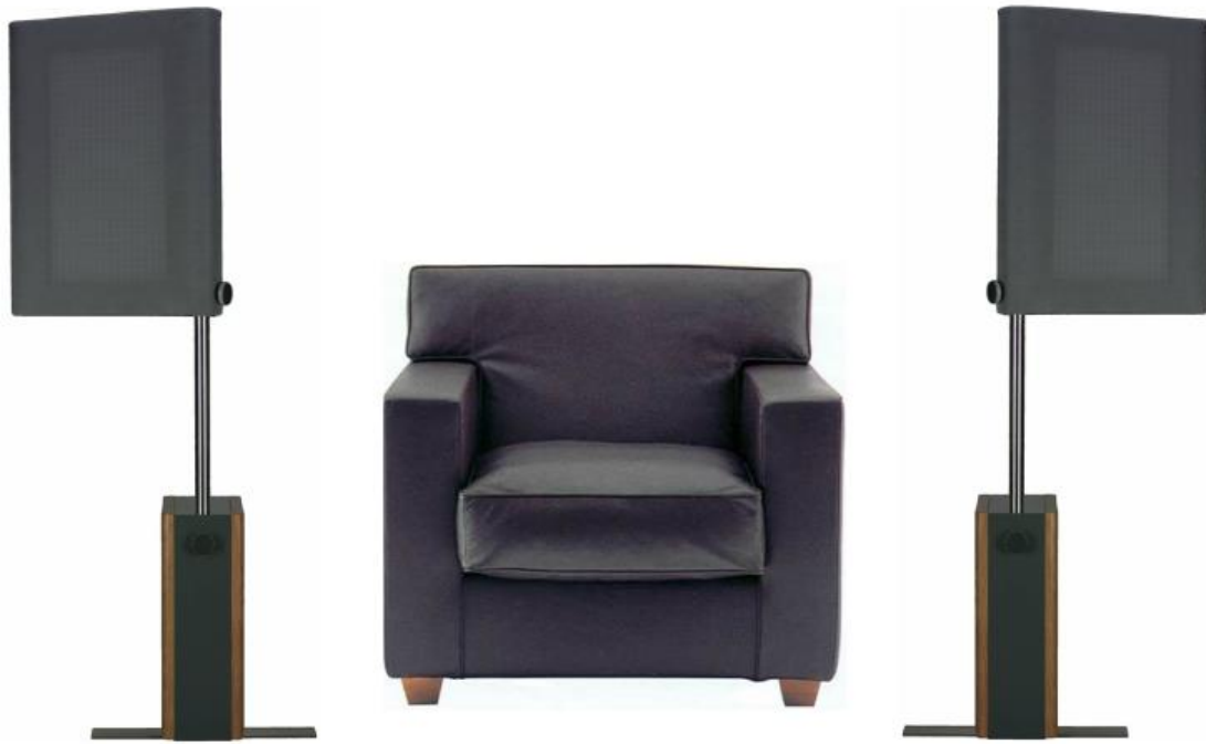
Grafik3: Aufstellung am Hörplatz (Einzelplatzvariante)