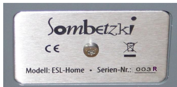
Logoabdeckung: 2. Anschlussfeld

Bitte vergessen Sie nicht die Abdeckung (LOGO) des unbenutzten Anschlussfeldes anzuschrauben bevor sie die Stromversorgung wieder herstellen. Betreiben Sie Ihre ESL HOME nie ohne diese Abdeckung.