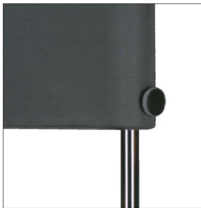
Grafik 5: Handrad am Kopf

Die optimale Hörposition bezogen auf die Höhe, befindet sich mittig vor dem Schallwandler. Damit Sie auf verschiedenen Sitzmöbeln Ihre Mittenposition einrichten können, ist der Lautsprecher-Kopf höhenverstellbar ausgeführt. Sie finden auf der Rohrseite am Kopf ein Handrad. Durch links drehen wird es gelockert. Nun können Sie den Kopf mit beiden Händen anfassend nach oben bzw. unten bewegen und anschließend durch rechtsdrehen sichern. Der Verschiebebereich beträgt ca. 20 cm. (s. Grafik 5 ).